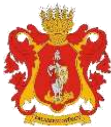
Zalaszentgyörgy Község Önkormányzata