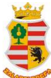
Zalaboldogfa Község Önkormányzata